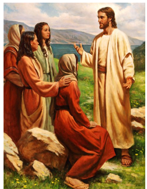
Gesù e le discepole