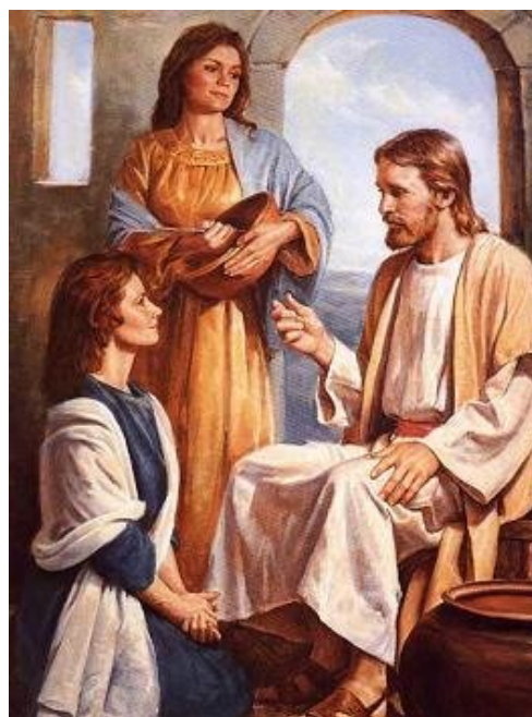
Gesù con Marta e Maria

Tuttavia, Gesù non pensava al ruolo delle donne in termini così ristretti, non