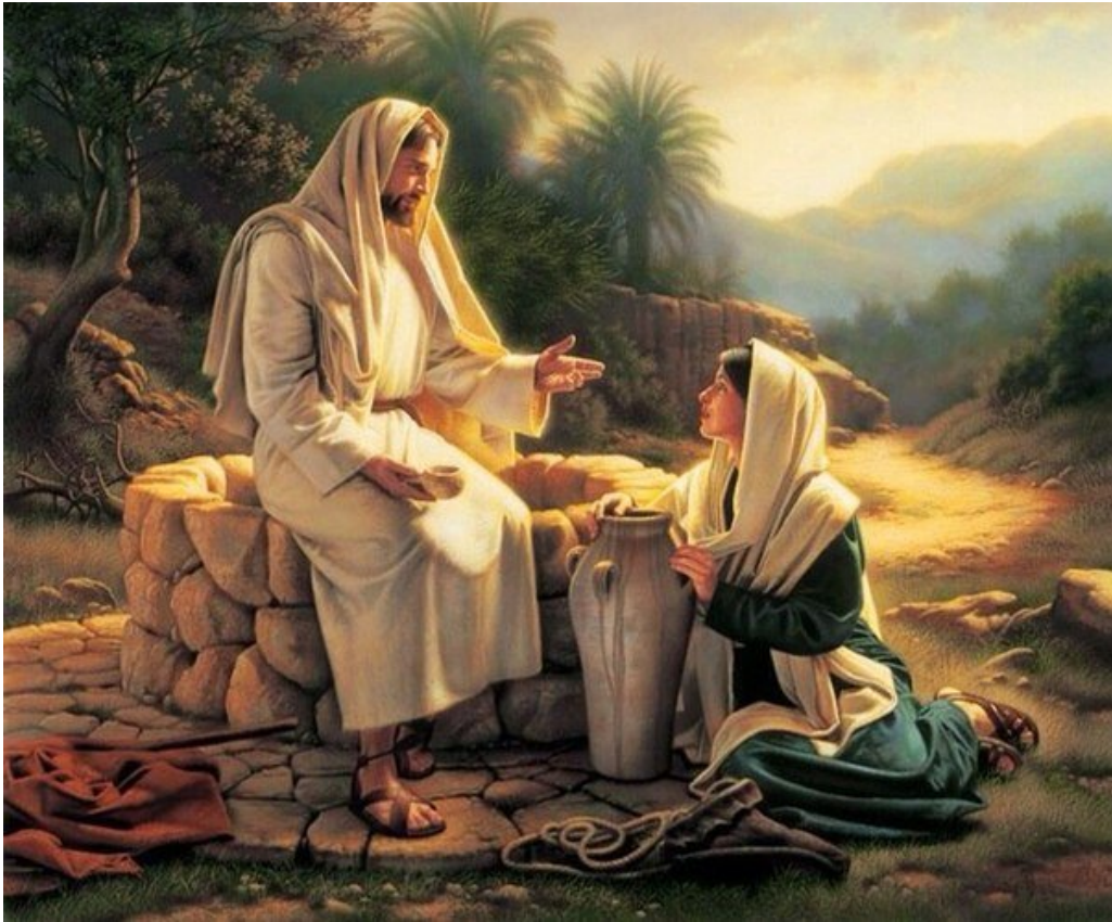
Gesù e la Samaritana

Proprio come quando Gesù si è rivelato a Marta e Maria durante la resurrezione di Lazzaro, Gesù si rivela qui in uno dei suoi ruoli chiave, il Messia ( Giovanni 4:25 ) ad un donna che immediatamente rese testimonianza agli abitanti di un villaggio. E' interessante notare inoltre che, apparentemente, la testimonianza di donne hanno un maggior peso tra i Samaritani che non tra gli ebrei. Molti Samaritani di quella città cedettero in Lui per la forza della testimonianza della donna. Sembra che Giovanni, nel suo Vangelo, abbia voluto rafforzare l'idea di dignità e la considerazione che Gesù aveva per le donne, ponendole sempre in un primo piano per quanto riguarda l'annuncio della salvezza.